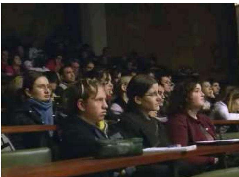
Les élèves du Fresne, attentifs, dans l'amphithéâtre