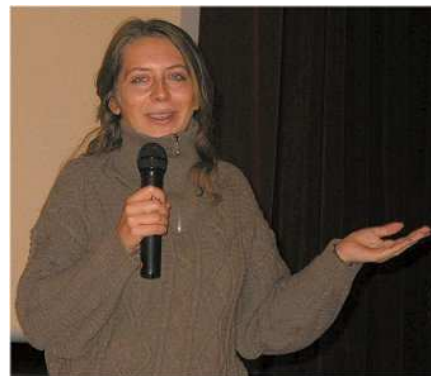
Nathalie Granger , réalisatrice, présente son film : Les Paresseux d'Ariane